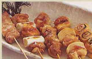
焼き鳥 (たれ・塩) Yakitori (tare/shio)