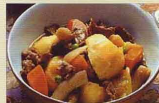
肉じゃが Niku Yaga

Cazuelita de carnes, mariscos y verduras