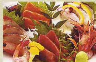
刺身盛り合わせ Sashimi Moriwase

Sashimi (filetes de pescado crudo) variados