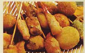
串揚げ Kushi Ague

Sashimi (filetes de pescado crudo) variados